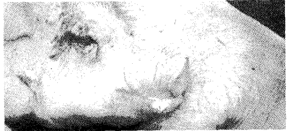
▲구제역(口蹄疫; Foot and Mouth Disease)이란 소, 돼지, 양, 염소, 사슴 등 발굽이 갈라진 우제류 동물에서 급성, 수포성 및 열성의 전염병으로 빠른 전파력을 특징으로 하는 바이러스성 감염증이다.

배출될 수 있다. 감염의 급성기 중에는 바이러스가 호흡기 공기 중으로 배출될 수 있어 공기 전염이 일어난다. 소에서는 회복기 중에도 바이러스를 옮길 수 있으나 돼지에서는 회복 후에는 바이러스를 옮길 수 없다. 구제역 바이러스는 소에서 2년간, 아프리카 물소에서 5년간, 그리고 양과 염소에서 수개월간 인두 내에 생존할 수 있다.