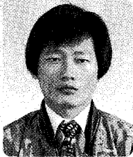
송금찬 농촌진흥청 농업경영관실