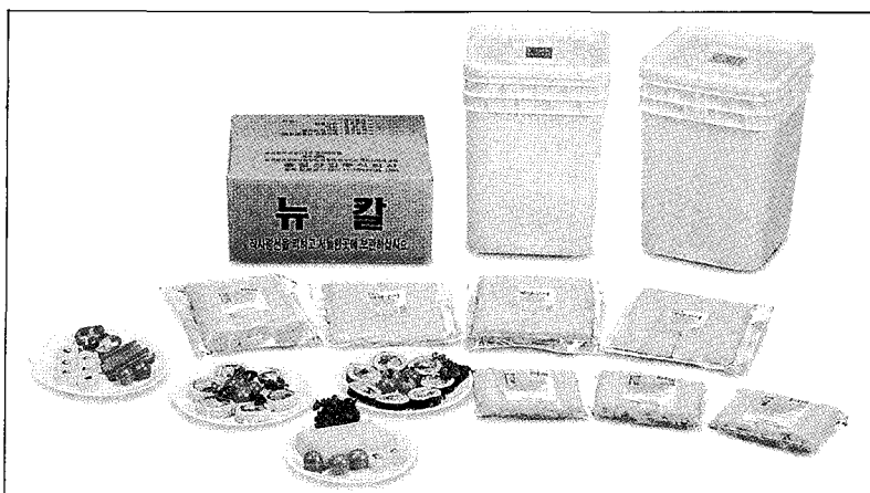
〈사진1〉 계란가공제품사진 (풍림산업)

우리나라는 중국, 일본, 대만, 홍콩 과 같이 음식문화가 발달되어 있으며 특히 건강에 좋