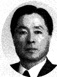
김 옥 경 국립수의과학검역원장