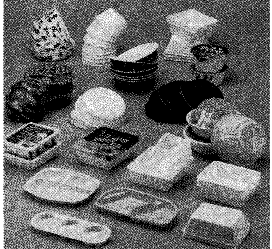
▲ (주)팔기의 P.P.S.P. Sheet 용기

원이 위생성을 필두로 새로운 기능을 가진 식품 용기 생산에 매진하고 있는 (주)팔기는 '단 한 개의 용기라도 청결하게' 라는 정신을 기본으로 삼고 있기도 하다.