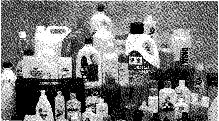
▶ (주)팔기의 주생산물

셈이라고 할 수 있다. 이처럼 큰 어려움과 소중한 경험을 준 IMF는 (주)팔기의 역사에 또 한번의 큰 변화를 갖게 한다. 바로 구조조정이 그것이다.