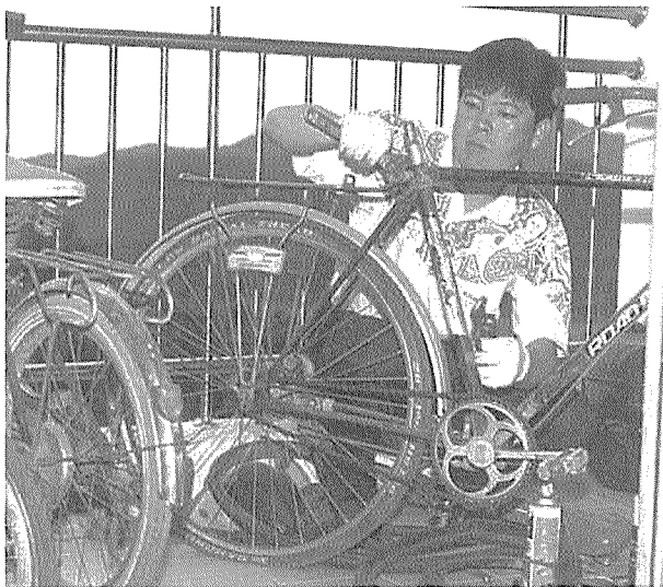
▲ 자신의 아파트에서 자전거를 고치는 모습

“이 일은 제가 손을 움직일 수 있는 한 계속 할겁니다. 영리목적이 아니니까요.”