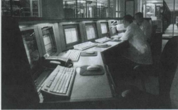
▲ 네트워크 콘트롤 센터

보스턴, 뉴욕, 워싱턴 DC, 애틀랜타에서 IDC를 운영하고 있다. 올해에는 런던에 이어 도쿄에도 150,000 평방 피트의 IDC 개설을 준비하고 있다. 시카고와 애틀랜타는 올해 개설한 IDC이며, 보스턴, 시애틀, 산타클라라에도 새로운 IDC를 추가하고 있다. 1999년은 11개의 IDC를 개설해서 총 19개의 IDC를 운영할 계획인데, 2000년은 12개의 IDC를 추가할 것이라 내다보고 있다고 한다. 매출은 계속해서 확대해 왔는데, 설비투자와 서비스 확대를 위한 기업 매수도 잇달아 했다. 1999년 소득세와 감가상각비가 확정되기 이전에 2억4,200만 달러의 매출을 올려서 1억3,000만 달러의 손실을 예상하고 있다.