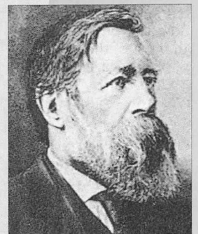
맨위부터 볼테르, 몽테스키외, 엥겔스.