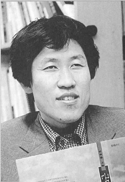
김동춘 교수 당대/A5신/392면/13,000원