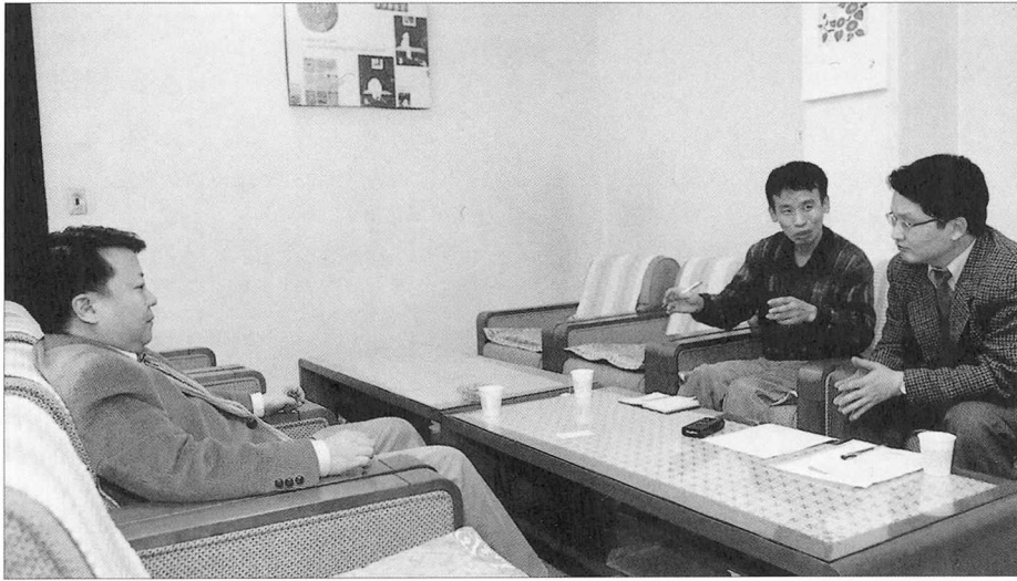
과학대중서 출판의 문제점과 대안에 대해 논의하고 있는 참석자들.

과학교양서의 주된 독자층이 누구인지, 퍼낸 책을 구체적으로 누가 읽고 있는지에 대한 조사조차 제대로 안 돼 있습니다.