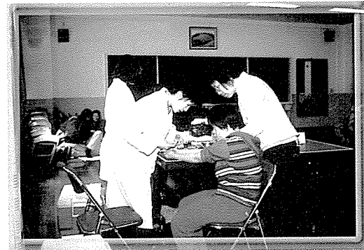
▲ 광주·전남지부는 세광학교, 선광학교, 선명학교인 장애인 사회복지학교와 광주소년원을 방문하여 300여명의 학생에게 기초검사, 혈액질환검사, 간기능검사, 당뇨검사, 고지혈증검사, 심장질환검사, B형간염검사 등 무료 건강검진을 실시했다.