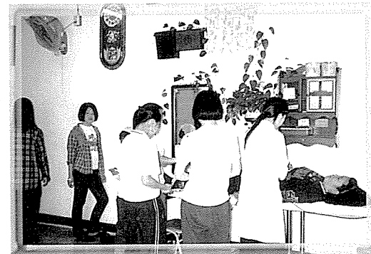
▲ 경남지부는 동보보육원, 인애원 등 420여명에게 혈액질환 검사, 간기능검사, 당뇨검사, 신장기능 검사, B형간염 검사 등 10개 항목을 무료검진 했다.