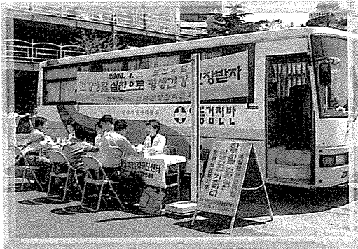
▲ 전북지부는 살림 재가 노인복지 센터, 산간·오지 지역 주민, 전주시 지역주민 등 580여명에게 기초검사, 소변 검사, 혈액질환검사, 간기능검사, 당뇨검사, 고지혈증검사, 심장질환검사, B형간염검사, 흉부질환검사, 혈액형 검사, 스트레스 측정 등을 실시했다.