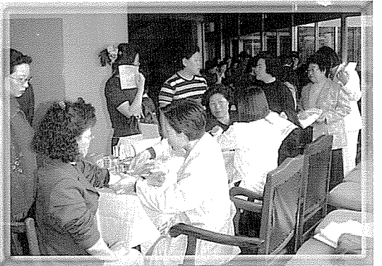
▲ 인천지부는 노숙자와 시민 220여명에게 무료 건강검진을 실시했다.