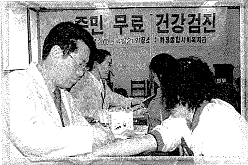
▲ 울산지부는 생활보호대상자, 일반인과 학생, 지역주민 등 440여명에게 당뇨검사 등 7개 종류의 무료검사를 실시했다.