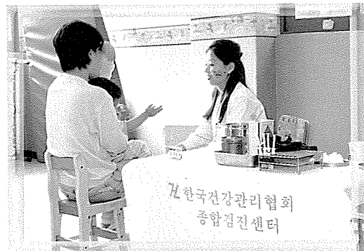
▲ 경북지부는 복지시설 장애 수용자 기관인 구미사랑터, 어린이집 등 수용자를 대상으로 무료 검진을 실시했다. 구미시청의 협조를 받아 시행한 이번 검사는 기초검사, CBC, 혈당콜레스테롤, 혈액형검사를 760여명에게 했다.