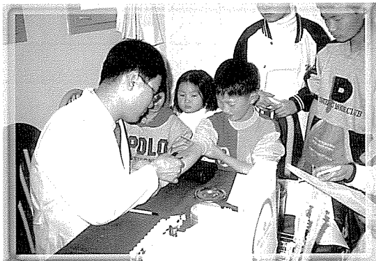
▲ 대구지부는 남산복지관, 애망원, 대구시민 등 5개 기관을 대상으로 기초검사, 혈액질환, 간기능, 당뇨, 고지혈, 심장질환 검사 등 무료 검진을 890여명에게 실시했다.