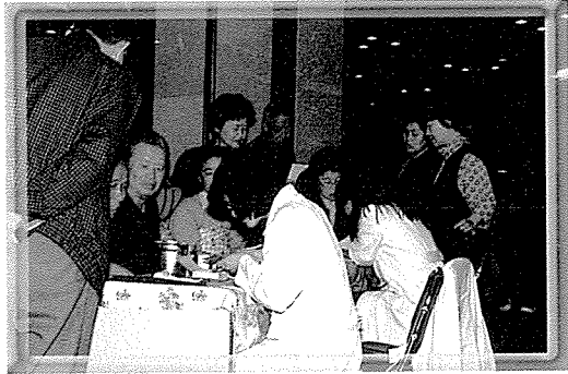
▲ 강원지부는 춘천시민을 대상으로 기초검사, 혈액질환검사, 고지혈증검사, 심장질환검사, 소변검사, 골다공증검사, 흉부 질환검사, 혈액형 등 11개 항목을 무료 검진 했다.