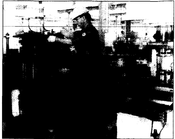
▲ 생산공장 내부 전경

마지막으로 도적으로 건강한 정신을 가지기를 바랍니다. 한탕주의를 쫓아 주식이나 도박으로 돈을 벌자는 생각은 위험하고 버려야 합니다. 그래서 개인이 발전하고 회사가 발전하고 나아가 사회가 발전하는 것입니다.