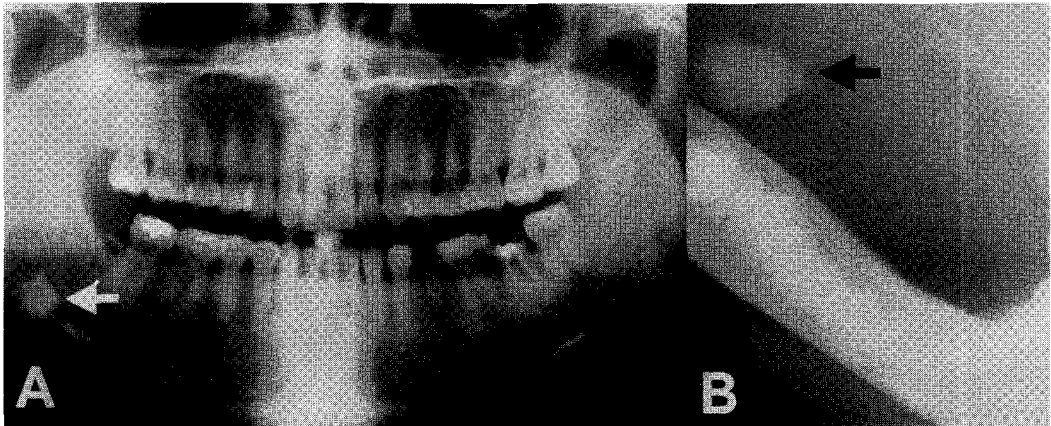
Fig. 3. Panorama (A) and occlusal view of right mandible (B) reveals a calcified stone in right submandibular gland.