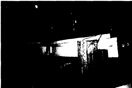
그림 3 PC보의 피로파괴

프로그램을 개발 중이다. 그 외에 산업체와 연계하여 파형강관, 차축 내구성 시험 등 여러 가지 실험을 수행하고 있다.