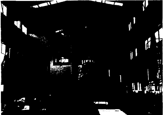
그림 1 구조실험동 내부 전경

동해석 및 설계에 관한 연구, 지반-구조물의 정적 상호작용 해석, 토목구조물의 자동화 설계 프로그램을 개발 중에 있다. 보수·보강 분야는 섬유 보강량의 산정과 정착에 관한 실험을 통해 계산식의 정립을 연구 중이며, 교량의 진동해석은 실측 가속도 자료를 이용한 변위추정에 관한 연구와 현수교의 기초설계를 위한 data base 구축 및 구조해석, 자동화 설계는 용벽과 Culvert의 구조계산 및 도면의 자동출력이 가능한 설계