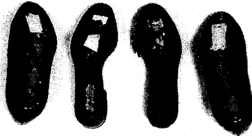
[그림2] 피착재의 박리 : 갑피와 결창

접착강도 실험에 영향을 주는 접착제에 관한 인자로는 주성분인 클로로프렌 고무이외에 소량 포함되어 있는 페놀수지의 영향을 들 수 있으며, 피착재에 관한 인자로는 천연혁, 직물, 텍손보드의 표면 상태와 표면 처리 방법 및 그 정도 등이다. 시험 방법에 관한 인자는 파괴 시험, 파괴시의 온도, 습도, 실험실의 상태 및 접착 접합부의 형상 등으로서 이들은 한국산업규격을 기준으로 일본산업규격과 상호 보완하여 검토 확인하는 것이 바람직한 것으로 판단된다.