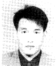
모 수 중