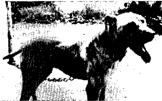
Fig 3. The American Pit Bull Terrier dog was completely recovered after treatment for 25 days.