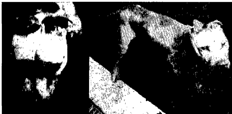
Fig 1. The clinical signs of tetanus shown with rigidity of limbs and raised tail-head (right photo) and stiff ears and trismus (left photo) from a 3 years old American Pit Bull Terrier.