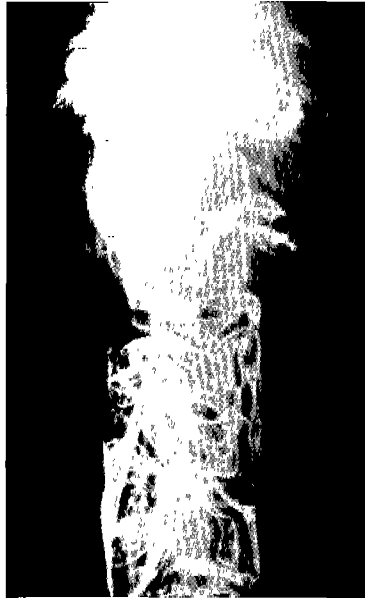
Fig 1. In modified method, the bowel transradiency is excellent and the small bowel images are well demonstrated. Therefore, all three readers graded this case as 'excellent'.