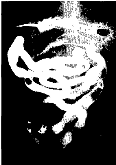
Fig 2. In conventional barium series the bowel transradiency is not very good, but the small bowel images are well demonstrated. Therefore, all three readers graded this case as 'good'.