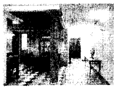
<그림6> 한남동 VERMILION HOUSE 인테리어 1998.7 p88

로코코 양식의 패널은 2사례 모두 호텔 객실에서 보여졌는데, 이는 로코코 시대에 보여지던 패널의 변형으로 한 사례는