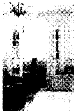
<그림10> 동부이촌동 APT 매종.1997.12. p 138

한편 문은 문의 형태와 몰딩, 2가지 측면에서의 적용을 보였는데 몰딩의 적용은 다시 문틀 몰딩과 문짝 몰딩으로 나뉘어 나타나고 있었다. 서양 고전양식을 적용한 문은 총 12사레로, 신고전 양식의 문 변형이 8사레, 르네상스 양식의 문 변형 4사레가 보여졌으며 원형은 나타나지 않았다.