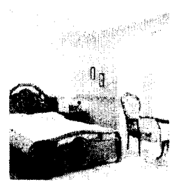
<그림2> 개포동 나연이네 현대주택 1995.9

식당에서는 전부 가구에서만 고전 양식이 보여지고 있는데, 로코코 양식이 4사례(57.1%)로 가장 많았고, 르네상스 양식, 바로크 양식, 신고전 양식은 각각 1사례씩 보여졌으며 혼합적용은 나타나지 않았다.