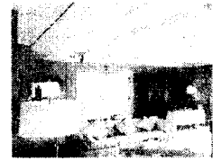
<그림8> 네덜란드 대사관저 현대주택 1995.3. p70

가장 많이 적용되고 있는 르네상스 양식의 천장으로는 프랑스 르네상스 시대의 목재 빔이 그대로 드러난 노출천장의 변형<그림7>이 10사례, 격자 틀의 목재가 드러난 경우가 2사례, 정사각형 구조의 우물천장(coffered ceiling) <사진8>이 2사례였다. 이때 나타난 노출천장은 한국 전통공간의 표현인 서까래와 혼동될 수 있는 요소로 그 구분은 적용된 공간 전체 분위기가 서양식 스타일인 경우만 포함시켰다. 목재 빔이 노출된 천장은 배열간격이 넓은 경우와 좁은 경우의 2가지 양상을 보였으며 아파트에서는 천장이 낮아 보여 실내가 좁고 답답해 보일 수 있는 것을 고려해 대체로 밝은 색의 목재를 쓰고 있었고 주택에서는 목재의 자연 색을 그대로 살리고 있었다. 우물천장이 적용된 사례는 르네상스 시대에 성당 천장이나 궁에서 주로 보여지던 육각형이나 팔각형이 아닌 정사각형의 우물천장으로 변형되어 쓰이고 있었다. 로코코 양식의 천장은 벽과 만나는 모서리 부분이 각지지 않도록 천장을 높여 자연스럽게 이어지도록 처리한 변형 사례였고, 신고전 양식이 적용된 천장은 벽의 코니스 부분에 쓰인 몰딩과 같은 굵기로 조명박스 주위에 원형 또는 사각의 몰딩 처리를 한 경우였다.