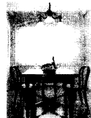
<그림12> 동부 이촌동 L세대 현대주택1998.11.p 53

이렇듯 실내를 서양 전통의 클래식 스타일로 꾸미는데 있어 가장 쉽고 대중적인 방법으로 가구를 이용하는 사례가 많았고, 한 공간 안에 서로 다른 양식의 가구를 함께 배치시킨 사례도 보여졌다.