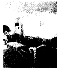
<그림1> 중동 태오네 현대주택1995.6.p61

다음으로 침실에서의 단일 적용은 로코코 양식이 5사례(가구 5), 신고전 양식이 3사례(문 2,장식 1), 르네상스 양식이 3사례(문 3)였고, 혼합 적용은 없었다. 결과적으로 침실에서는 로코코 양식이 가장 많이 적용되고 있었는데 모두 가구에서 보여졌다.<그림2> 이렇게 로코코 가구가 주거공간에서 선호되는 이유는 기능적으로 편안하고 안락한 느낌을 주는 동시에 실내를 모던하고 심플한 현대적 공간으로 구성해도 가구 자체만으로 클래식한 분위기를 만들어내는 장식효과가 뛰어나기 때문이라고 볼 수 있다.