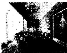
<그림5> 하얏트 호텔 프레지덴셜 룸 다이닝룸 매종 1997.8.p117

가장 많이 나타난 신고전 양식을 적용한 벽을 구체적으로 살펴보면, 니취를 만들어 장식적 목적으로 사용하는 경우(3사례)와 직선 패널의 벽(3사례), 벽과 천장이 만나는 모서리(코니스 부분)와 벽과 벽이 만나는 모서리 부분에 신고전 양식의 몰딩과 벽기둥으로 마감한 사례(3사례)가 있었다. 르네상스 양식이 적용된 벽을 보면 영국 르네상스 실내의 벽 마감으로 자주 쓰였던 회반죽 마감(1사례), 회반죽 마감에 궁형 아치의 벽감이 있는 경우(1사례), 창가 쪽은 르네상스 성당의 회랑이나 palazzo의 중정에서 나타났던 기둥과 아치가 반복되는 아케이드 형식으로 처리하고 맞은 편에는 테피스트리를 걸어놓은 경우가 1사례<그림5> 보여졌다.