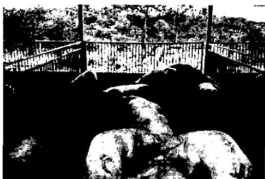
Fig. 3. Phased sight of PDF20 on the floor of pigpen (3wk).