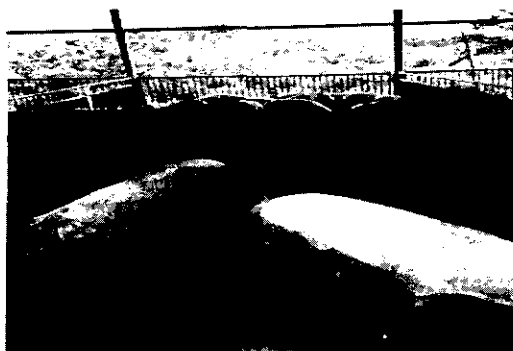
Fig. 1. Phased sight of sawdust on the floor of pigpen (3wk).