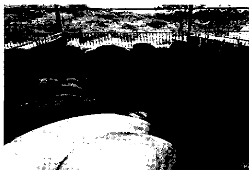
Fig. 2. Phased sight of PDF10 on the floor of pigpen (3wk).