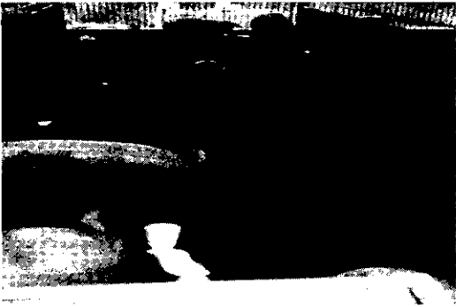
Fig. 5. Phased sight of PDF20 on the floor of pigpen (4wk).