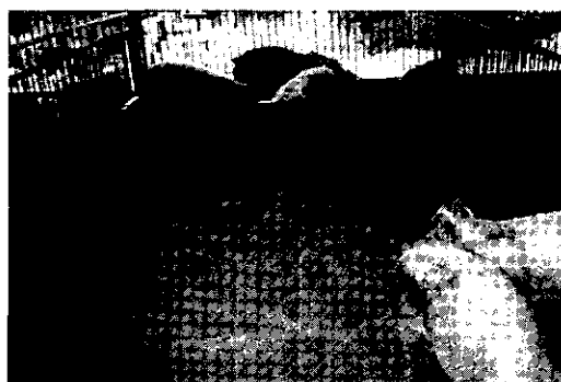
Fig. 4. Phased sight of PDF30 on the floor of pigpen (3wk).

20%처리(PDF20)구와 30%처리(PDF30)구에서는 그림 3, 4에서 보는 바와 같이 노배설장소의 폭이 대조구와 PDF10구에 비해 좁고 곤죽된 부분이 적게 나타났고, 돈방이 전체적으로 양호한 상태였으며, 돼지의 피모상태도 매우 양호하였다.