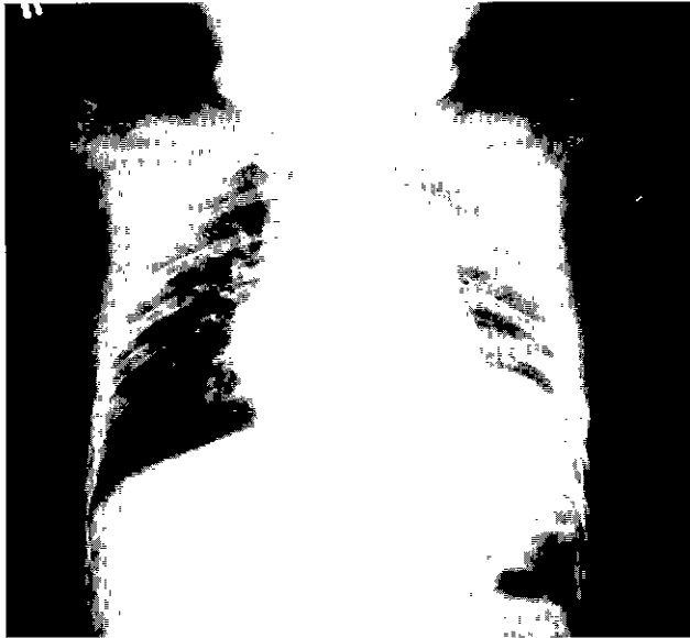
Fig. 4. Postoperative chest x-ray.

고, 테두리 내부에는 석회화가 있으면서 저음영(low density) 조직이 불균질(heterogenous)한 소견을 보였으며, 종양과 종격동 조직사이의 감쇄계수가 -88.9로 나왔다. 컴퓨터 단층촬영의 감쇄계수(Hounsfield units)는 지방조직의 경우 -70에서 -130이고 공기의 경우 -1000으로 나오는데 9) , 본 환자의 경우 -88.9로 나와 공기보다는 지방조직이 종양과 종격동사이에 있는 것으로 판단되어 종격동 종양으로 결론내렸다. 소아 종격동의 종양은 림파종(lymphoma), 생식세포종양(germ cell neoplasm), 흉선종(thymic tumor)순으로 발생하는데 6) , 림파종은 종양내부에 석회화가 존재하지 않고, 흉선종은 주로 성인에서 발생하고 종양내부음영이 균질(homogenous)하게 되어있으며 고음영의 테두리가 없다는 점에서 본환자의 소견과는 달랐다. 기형종(teratoma)은 컴퓨터 단층촬영 소견상 주위조직과 잘 구분이 되고, 종양내부에 석회화가 있으며 내부에 지방조직이나 연조직 등으로 인하여 저음영 조직소견을 나타내는 점등으로 7) 본환자의 소견과 일치하여 술전에 양성 기형종(benign teratoma)으로 판단하여 수술을 하게되었으나 실제 수술장에서는 좌폐상엽 종양이었다. 즉 종양과 종격동사이의 지방조직이 아닌 공기가 존재하고 있었는데 이렇게 감쇄계수가 공기가 아닌 지방조직으로 나온 것은 컴퓨터 단층촬영상에서 감쇄계수를 측정할 때 측정하려는 지점이 넓은 경우는 문제가 되지 않지만 본 환자와 같이 측정하려는 지점이 아주 좁은 경우 주위의 조직 즉 종양과 종격동 조직의 영향으로 공기보다 높게 수치가 나온 것으로 판단된다. 핵자기 공명영상은 여러 방향으로 조직을 절단할 수 있고, 연부 조직을 좀더 자세히 관찰할 수 있으므로 종양과 종격