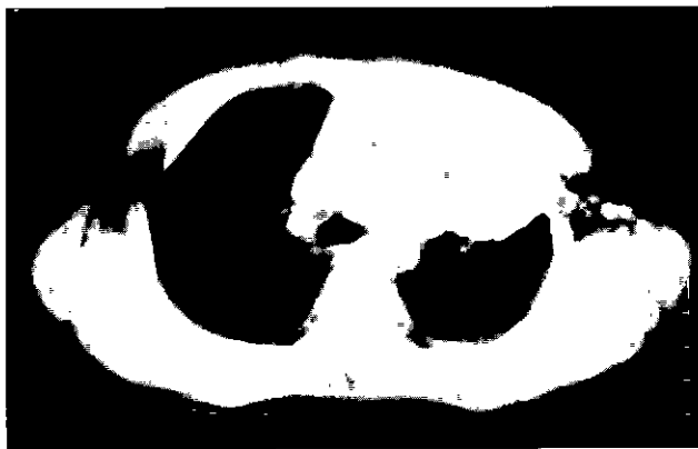
Fig. 2. Preoperative chest CT.

수는 6900/\text{mm}^3 이었고, 혈청검사 및 간 기능검사는 정상이었다