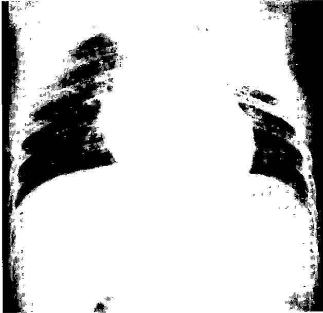
Fig. 1. Preoperative chest x-ray