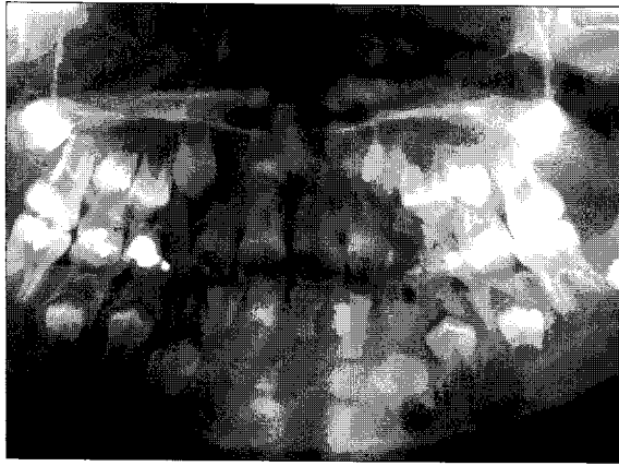
Fig. 1. Panoramic view.