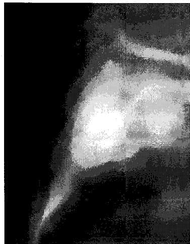
Fig. 4. SCANORA® view (right mesiodens).