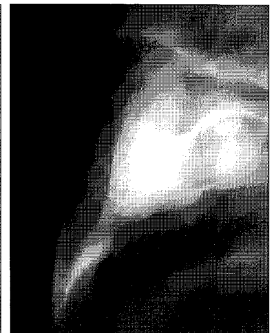
Fig. 5. SCANORA® view (left mesiodens).