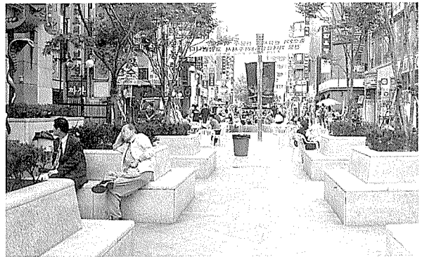
종로2가 가로공원 조성 후의 모습

도로가 개선되었다고 일을 끝낼 순 없었다. 인접한 모든 건축물들이 새로이 단장하고 통일된 awning을 설치할 것을 추가로 요구했다. 나무도 거리 역사와 맞게 오래된 것이 좋겠다고 했다. 항상 청결하고 우리 것이라는 생각으로 유지관리를 해달라고 요청했다.