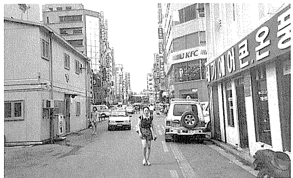
종로2가 가로공원 조성 전의 모습