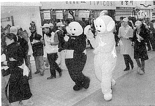
〈청주시 성안길에서 캐릭터와 함께 거리캠페인〉

우리 협회는 12월 1일 청주백화점 앞 광장과 고속버스터미널 일대에서 문화관광부가 추진하고 있는 ‘전국민 책읽기 운동’ 사업의 일환으로 거리 캠페인을 벌였다. 이날 거리 캠페인에서는 인기작가의 사인회 및 시낭송도 함께 있었으며, 청주 예술의 전당에서 개최된 제2회 ‘전국문화기반시설관리책임자 대회’에 참석한 전국의 문화시설 관리책임자, 자치단체 문화행정 책임자, 평가위원, 연구진 등 1천여명에게 ‘전국민 책읽