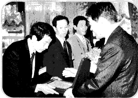
◆ 협회장 표창패 시상. 우리 생약살리기와 회세신장에 기여해온 5명의 산하 회원들에게 협회장이 표창패를 시상하고 있다.