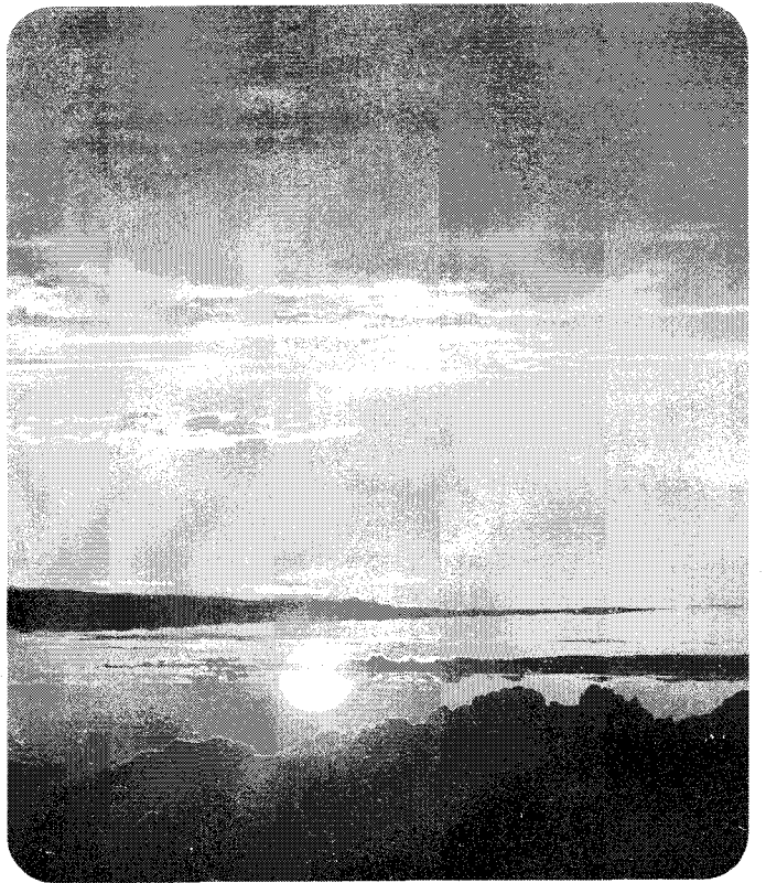
▲희망찬 기묘년 새해가 밝아오고 있다. 지난해 생약업계는 IMF한파 못지않은 태풍과 폭우등의 기상재해로 어려움이 많았지만 올해는 경기회복에 힘입어 다소 활기를 찾을 것으로 기대되고 있다.

새해에도 우리협회는 생약농업의 경쟁력 향상을 위해서 저비용 고품질 생약재 생산과 지역 주생산 품목의 상품화, 국산 생약과 수입품의 차별화를 위해 노력함은 물론 친환경적 생약농업의 지속적 발전 그리고 기술기반의 확충 및 새로운 수요와 시장개척 등 농가소