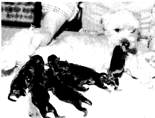
▼ 인공수정으로 출생한 '요크'와 자전들

그리고 4월 22일 내원, 초음파로 확인한 결과 6마리가 임신이 확인됐다. 그리고 임신이 잘 진행되어서 5월 20일 본 병원에서 암컷 5마리, 수컷 1마리를 정상 분만하여 집으로 보내고 필자도 Canine Reproduction을 배우면서 여러 가지 불임원인 중에 하나인 질협착(Strictures)를 진단하고 인공수정으로 임신과 자연분만 까지 전 과정이 아주 잘 진행되어 냉동정액을 이용한 인공수정에 필자 나름대로 확신을 가지게 되었다.