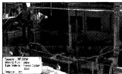
▲ 에너지기술연구소에 설치된 분리형 히트파이프식 열교환기