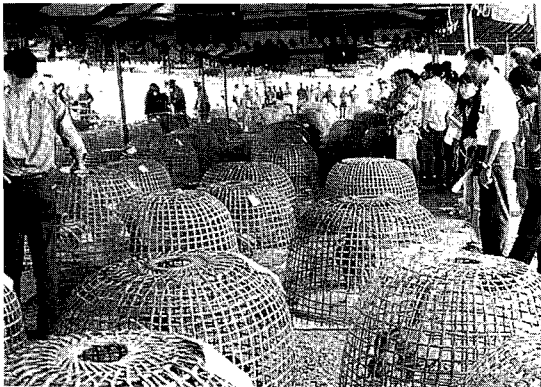
△ 경쟁을 기다리는 투계들이 비구니 속에 담겨져 있다.

태국의 양계경기가 어려움에 처하자 대중 스포츠로 각광을 받고 있는 투견대회가 색다른 모습으로 변모하며 양계경기에 일익을 담당하고 있는 것으로 나타났다. 기존에는 투계대회가