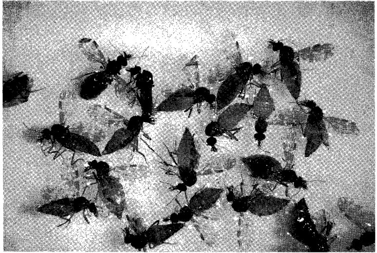
△ 류코사이토준병의 원충인 닭겨모기

본병은 닭겨모기가 발생되는 시기인 6월이후부터 닭에 발생되기 시작하여 9월말까지 나타나며 10월 이후에는 감소하기 시작한다. 그러므로 지금부터가 예방에 있어서 중요한 시기라 하지않을 수 없다. 발병은 모기와 밀접한 관련이 있으므로 모기가 많은 양계장이나, 여름철 정기적인 살충을 하지 않는 양계장에서는