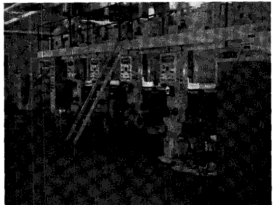
▲ 한국제대(주)의 그라비아인쇄설비

고무판인쇄 등 각 유저별로 인쇄적성에 따른 인쇄방법을 채택하고, 고객이 만족할 수 있는 최대치를 이끌어내고자 최선의 노력을 기울이고 있다.