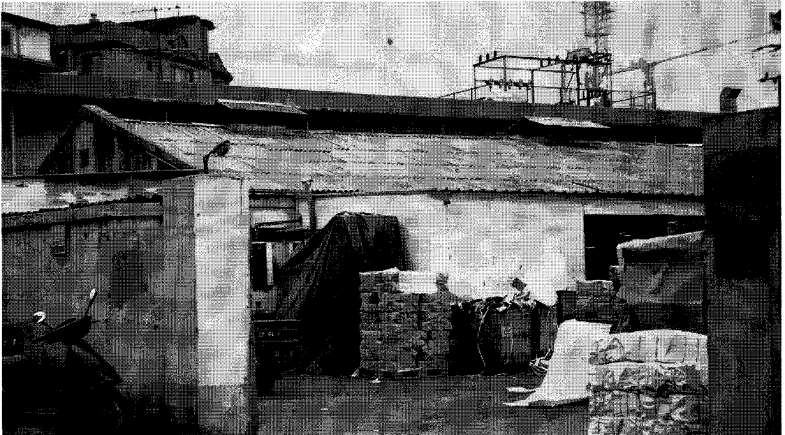
▲ 한국제대(주) 제1공장 전경

“사장님의 의지가 우선 컸고, 전 직원이 포장업체를 대표할 수 있는 한국포장협회 가입에 긍정적이었습니다”라며 (사)한국포장협회 회원가입