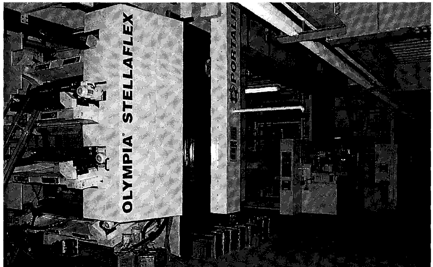
▶ 한국제대(주)의 플렉소 인쇄 시스템

한국제대(주)는 이와 같은 중요성을 진작 인식하고, 좀 더 완벽한 품질을 위해 1공장에서는 제