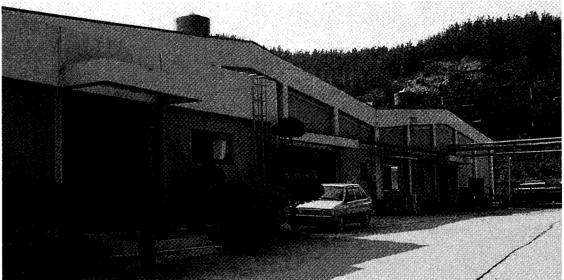
▲ 태신인쇄(주)의 청원공장 전경

태평양의 계열사이기 때문에, 그리고 합병을 통해 그만큼의 역량을 갖추었기 때문에 가능했던