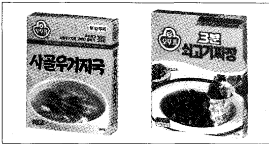
▲ 오뚜기 레토르트 즉석식품