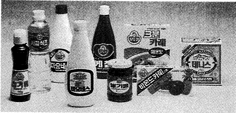
◀ 오뚜기의 주요생산제품들

로 품목을 개발하고 있는 오뚜기는 1973년 품림 상사에서 오뚜기식품공업(주)로 회사명을 변경하고 공장을 대폭 증설하는 등 많은 변화를 시도했다. 그러던 중 1981년에는 국내 경쟁회사 외에도 세계적인 기업인 미국기업이 한국조미료회사와 합작하여 베스트푸드 마요네즈를 생산해 오뚜기는 어려움을 겪기도 했으나 84년, 고소하고 윤기있는 '골드마요네즈'의 출시로 시장을 확보하는데 성공했다.