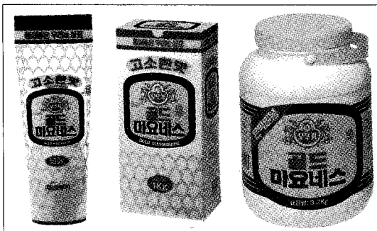
▲ 오뚜기 대표품목으로 꼽을 수 있는 마요네즈와 케첩

한국패키지디자인협회 회원으로 활동하고 있기도 한 디자인실 임영우 과장은 "저희 오뚜기는 제품의 주 칼라인 노란색을 꼭 삽입해야 하다 보니 제품의 특징을 살리는 데 가장 큰 어려움을 느낍니다"라고 밝히며 국내 인쇄기술이 전반적으로 미흡한 편인데 특히 캔과 같은 특수인쇄 부