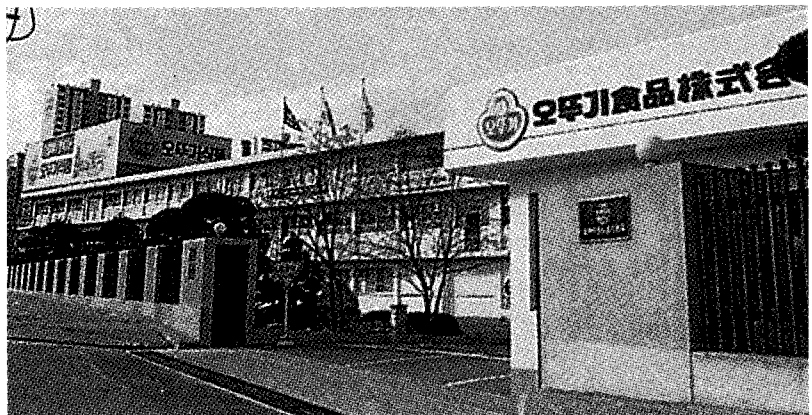
▶ (주)오뚜기 안양공장 전경