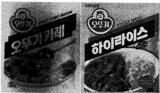
▲ 오뚜기가 처음 선보인 카레와 하이라이스

를 꾀했던 오뚜기는 꾸준한 노력으로 1990년에 접어들면서 크게 판매망을 확보하여 현재는 농심, 삼양에 이어 식품업계 3위를 차지하고 있으며 2위인 삼양과는 근소한 차이를 두고 있다.