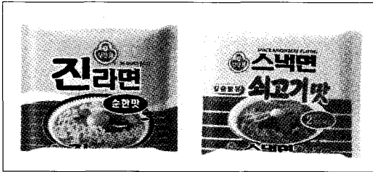
▲ 현재 업계 2위를 차지하고 있는 라면류