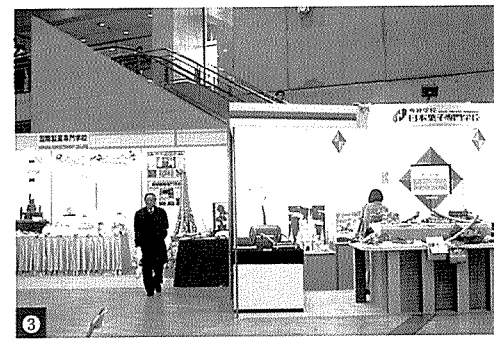
① 전시장 입구에서 개막을 알리는 퍼레이드를 펼치고 있다. ② ③ 이번 전시회에는 동경제과학교와 일본과자전문학교 등 일본 제과학교 6개가 모인 스쿨 프라자가 별도로 마련되었다.