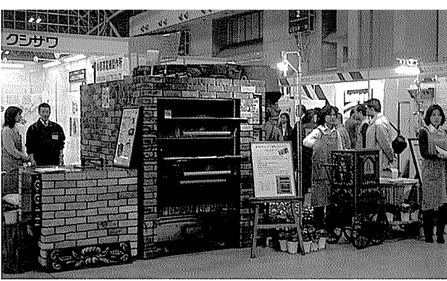
▲ 쿠시자와사가 선보인 독일식 가마. 이 업체는 이번 전시기간동안 독일식 가마의 노하우를 공개했다.