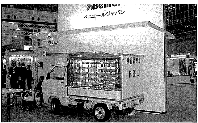
▲ 베니에르사가 선보인 이동판매차량에 관람객들의 시선이 집중되었다.

특히 이번 모박쇼는 일본의 제과제빵 전문학교들이 모여 작품을 전시하고 제품을 실연한 스쿨 프라자(school plaza)와 참가 업체에서 전문 담당자를 배치해 기술 상담을 벌인 제과제빵 기술 상담코너, 참가 업체 중 희망회사에 한해 자사 PR 및 신제품과 기술을 선보이는 모박쇼 세미나 등 다양한 기획과 이벤트로 구성되었다. 그 외에도 관련업체를 견학할 수 있는 관련업체 시찰 투어와 관련 전문 도서코너, PR 코너 등이 마련되기도 했다. 이번 전시회에는 지난 전시회보다 참가국이 늘어났는데 우리나라에서는 유일하게 제일제당이 부