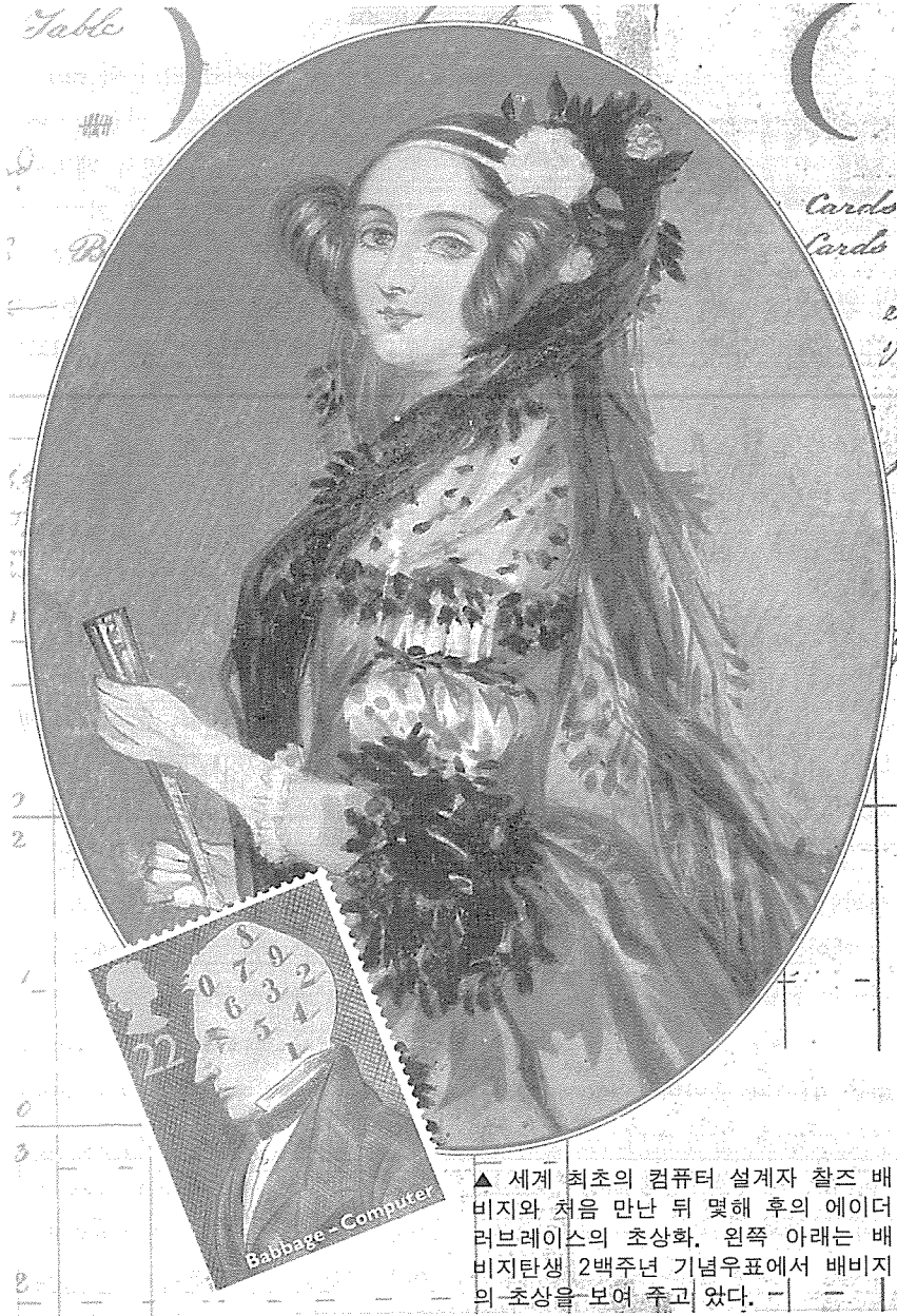
▲ 세계 최초의 컴퓨터 설계자 찰스 배비지와 처음 만난 뒤 몇해 후의 에이더 러브레이스의 초상화. 왼쪽 아래는 배비지 탄생 2백주년 기념우표에서 배비지의 초상을 보여 주고 있다.

테마는 분석기계가 자카드 펀치카드를 사용하여 프로그램하는 능력에 대한 의의에 관한 것이었다. 에이더는 또 코드를 다시 사용할 수 있는 분석기계의 능력의 장점을 설명하고 부호 처리능력을 설명하면서 음악을 작곡하는 잠재력에도 언급했다. 에이더는 이 기계가 인간이 생각하는 것처럼 '생각한다'는 잘못된 주장의 정체를 벗기면서 '우리가 성취하도록 명령하는 방법을 알고 있는 것은 무엇이든지 할 수 있다'고 주장했다. 그로부터 한세기 뒤 앨런 튜링은 인공지능에 관한 역사적인 강연에서 에이더의 이 말을 인용했다.