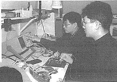
▲ 연구원들이 운용체제 작동실험을 하고 있다

불과 10여년 전만 해도 컴퓨터를 가방에 넣고 다닌다는 것은 꿈같은 이야기였다. 하지만 요즘은 많은 사람들이 노트북 컴퓨터에 친숙할 뿐 아니라 이제는 은근히 어깨를 조여 오는 무게, 언제 방전될지 모르는 배터리, 복잡한 조작기능에 불만을 토로한다. 더구나 이동하면서 자료를 검색하고 정보를 주고 받기를 원하는 사람들은 이동컴퓨팅(mobile computing)에 알맞는 좀더 작고 가볍고 조작이 편리한 제품은 없을까. 전자수첩 크기의 휴대형 정보단말기(PDA)가 그 해답이 될 수 있다. PDA(Personal Digital Assistant)란 손바닥에 놓고 사용할 수 있는 조그만 컴퓨터이다. 주소록이나 일정 관리, 계산기 기능은 물론이고 무선통신과 다른 PC나 PDA와의 데이터 교환이 가능한 대표적인 차세대 정보장치로 복잡하지 않아 초보자들도 금세 익숙해진다. 아직 우리에게 낯선 PDA는 작년 미국 쓰리콤의 '팜파일럿'이 전