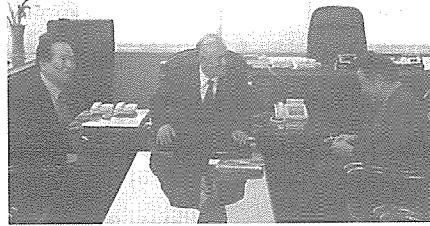
▲ 최형섭회장이 레오 에자키이사장(오른쪽)을 접견하고 있다. 왼쪽은 চে영복 과총부회장

최형섭 과총회장은 지난해 11월28일 1973년도 노벨물리학상수상자이자 전 쓰꾸바대학 총장인 레오 에자키 일