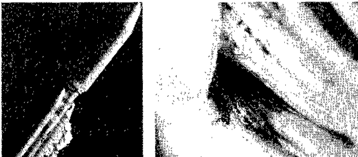
페이로드 페어링이 분리되기 직전 화염이 치솟고 있다(사진 왼쪽) 손상된 전기 배선이 발사실패의 주범이었다(사진 오른쪽)

NASA에서는 자이로 시스템의 기능상실에 직면해 있는 허블 망원경의 수리를 위해서 예정에 없는 임시 비행계획을 검토하고 있다. 현재 허블 망원경 6개의 자이로 시스템 중 3번 자이로가 기능을 상실한 상태이며 NASA에서는 2000년 6월로 예정된 제 3회 정기보수계획을 앞당기는 방안을 검토 중이다. 자이로 시스템은 허블 망원경의 정교한 자세