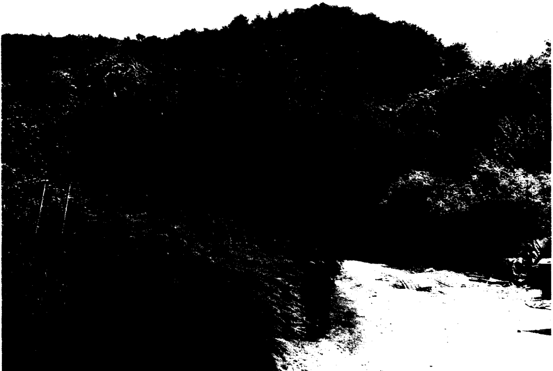
▲강숙자 푸른조경 대표