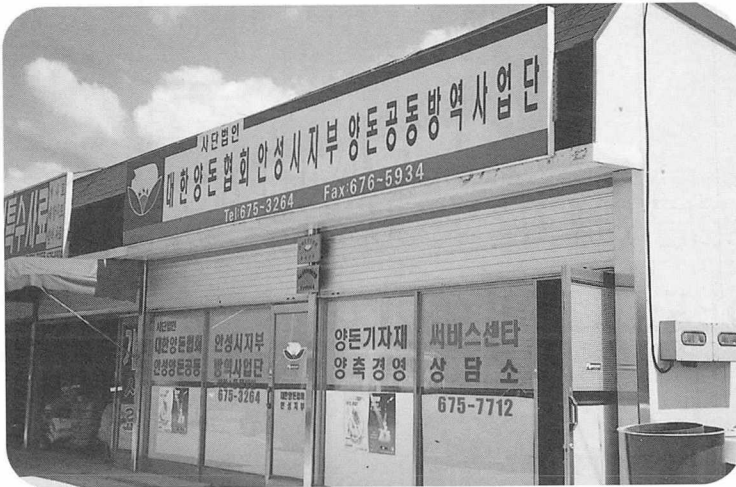
안성 양돈공동방역사업단 사무소 전경

한 수출길이 막힘으로 인한 피해액이 무려 8조9천억원(대만 행정원의 추정자료)이며, '99년 현재 사육두수가 37%, 사육호수가 32% 감소한 사례에서도 그 피해 정도가 얼마나 심각한 문제인지를 짐작할 수 있을 것이라 하겠다.