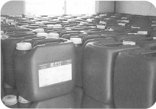
◀시 당국에서도 방역장비, 채혈 소모품 등의 장비비를 지원하고 있다.