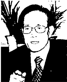
김승호 사립학교 교원 연금 관리공단 이사장