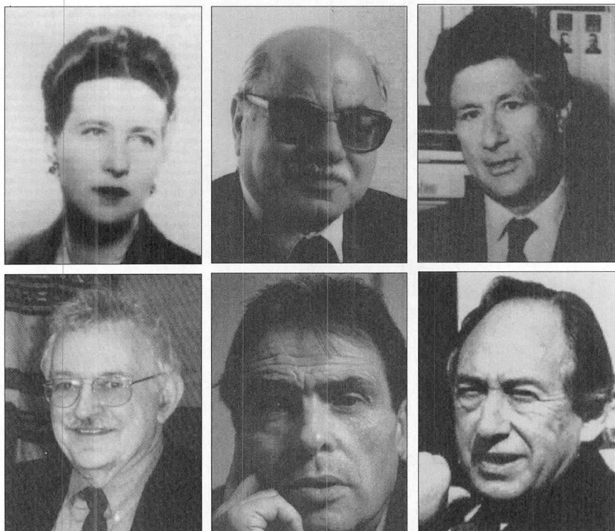
윗줄 왼쪽부터 보바르·벨·사이드·윌러스틴·부르디외·토플러.

시몬드 드 보바르의 《제2의 성》은 페미니스트 이론의 효시를 이루는 중요한 저작이다. 남성은 독립적인 존재로 인식되지만, 여성은 남성과의 관계를 통해서만 존