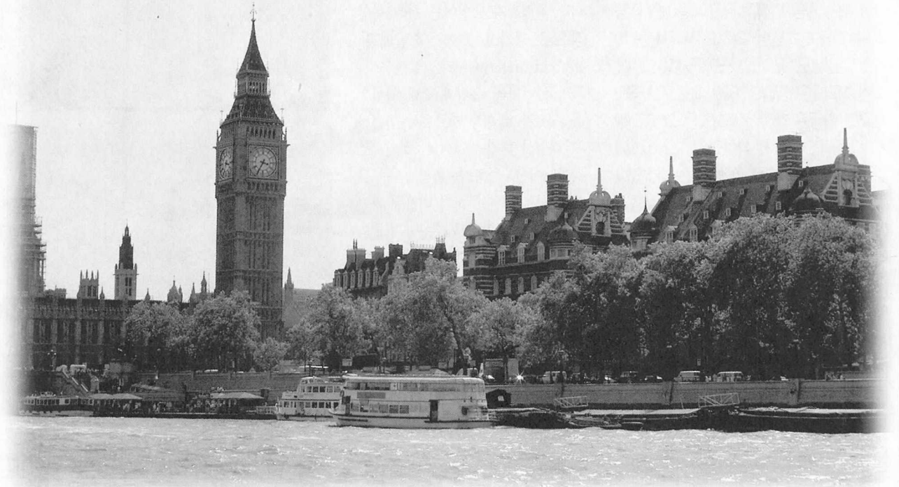
런던 시내를 흐르는 템즈강을 바라보며 서 있는 빅벤.

최근 활발해진 인스합병을 통해 출판사와 서점이 대형화되면서 나타난 현상은 1백년 가까운 전통의 도서정가제인 NBA(Net Book Agreement)가 붕괴됐다는 점이다. 출판시장이 베스트셀러 위주로 재편되고 미 국계 대형서점이 할인판매를 주무기로 들고