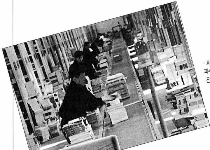
· 파주시 교하면에 자리한 파주출판물류(주)의 전산 배본 시스템(위). · 도난방지가 설치된 창고, 평당 3천부를 보관할 수 있다(아래).

시설 운용에 따른 수익으로 운영된다. 한편, 사업장을 이전한 ‘날개’의 기존 사업은 그대로 유지한다.