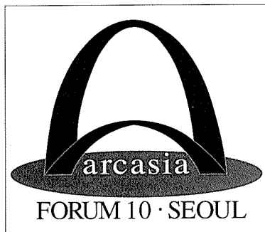
디자인 / 최영집

제10회 아카시아포럼(10th ARCASIA Forum)이 본협회(KIRA) 주최로 오는 9월 13일부터 동월17일까지 서울 삼성동 소재 호텔 인터컨티넨탈 서울(Hotel INTER · CONTINENTAL Seoul) 국제회의장에서 개최된다. 「아시아에서의 기술, 전통 그리고 건축」을 주제로 열리는 이번 토론회에는 우리나라를 비롯해 중국, 일본 등 아시아지역 15개 회원국 대표단과 행사관계자 그리고 일반참가자 등 약 1천여명이 참가해 아시아지역 건축사들간 유대를 강화하고 주제토론을 통한 기술교류와 건축정보 등을 교환하게 된다. 5박 6일간의 일정으로 진행될 이번 행사는 4개의 포럼과 함께 공식행사로 아카시아 이사회와 교육위원회 회의가 열리며, 아시아건축상 시상식과 각종 전시회, 건축탐방, 한국건축소개 등 다양한 부대행사가 있을 예정이다.