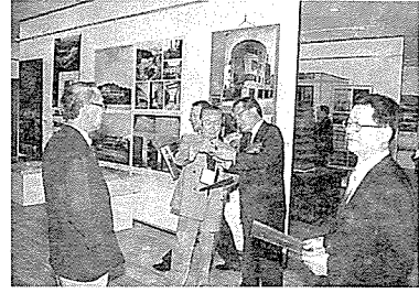
양과학대 학생전」 그리고 제5회 아카시아 건축상 수상작 전시 등이 이어진다.

월드컵상암구장」, 정림건축의 「국립중앙박물관」 등 50점이 전시됐으며, 기흥성조형에서 협찬한 한국전통건축물 모형 2점도 함께 전시돼 관람자의 관심을 모았다. 이번 초대전은 당초 9월 30일까지 전시하기로 한 것을 학생들의 연장요청으로 10월 18일까지 전시하게 됐다. 한편, 9월 9일 전시개막행사를 갖고 출품자들에게 기념메달을 증정했다. 아키텍트갤러리에서는 「건미회 미술전」과 「안