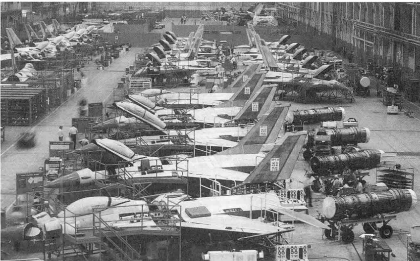
F-16 조립 공정

위임함에 따라, 국제안보담당 차관(Under Secretary of State for International Security Affairs) 예하 정치,