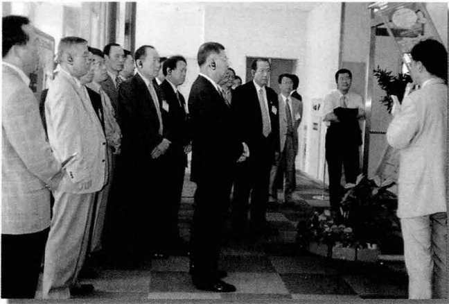
신 메이와 공업을 방문해 해상자위대 US-1 생산 공장을 견학하는 방산업체 대표단

한국 방위산업체 대표단의 일본 방문이 지난 7월 25일부터 31일까지 6박 7일의 일정으로 이루어졌다.