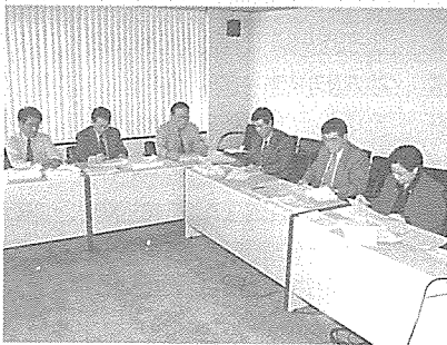
▲ 금연글짓기 작품심사

초등학교 학생 12,677명이 응모했으며, 대상·금상을 비롯한 총 7개 부문에서 942명의 학생이 상을 받게 되었다.