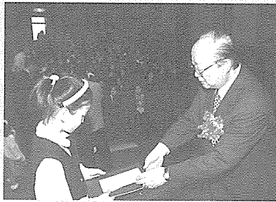
▲ 금연글짓기 시상식

자라나는 어린이들에게 흡연으로 인한 건강 상의 피해와 금연으로 얻어지는 효과를 일깨우는 한편, 조기 금연교육을 통해 금연의 사회적 분위기를 확산과 장기적 측면에서 금연연구 저변 확대를 위해 실시된 이번 글짓기에는 전국