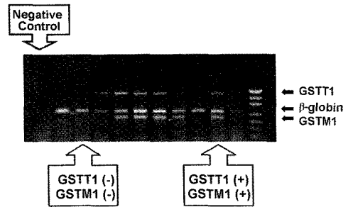
Fig. 1. The multiplex PCR of GSTM1 and T1.

NAT1의 경우 기존에 3개 이상의 유전자형이 알려져 있는데, 염기서열순위 1088번에 점돌연변이(A → T)가 생기면 Mbo II에 의한 DNA 절단이 되지 않는데 이는 NAT1*10이라 명명되며 여러 암의 위험